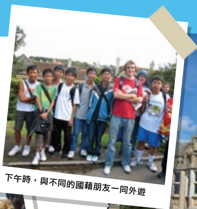
下午時，與不同的國籍朋友一同外遊