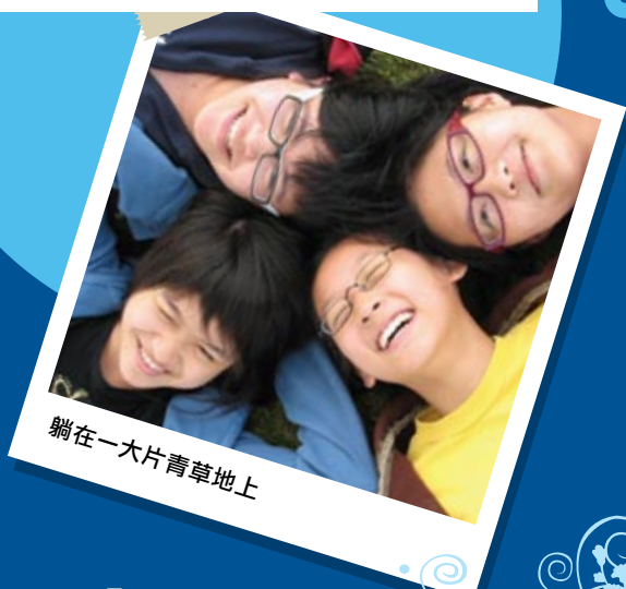
躺在一大片青草地上