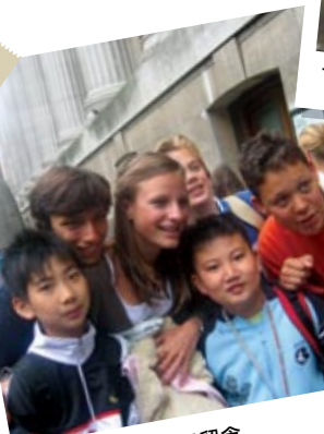
到達觀光地點拍照留念