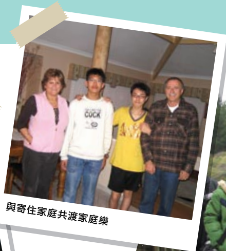
與寄住家庭共渡家庭樂